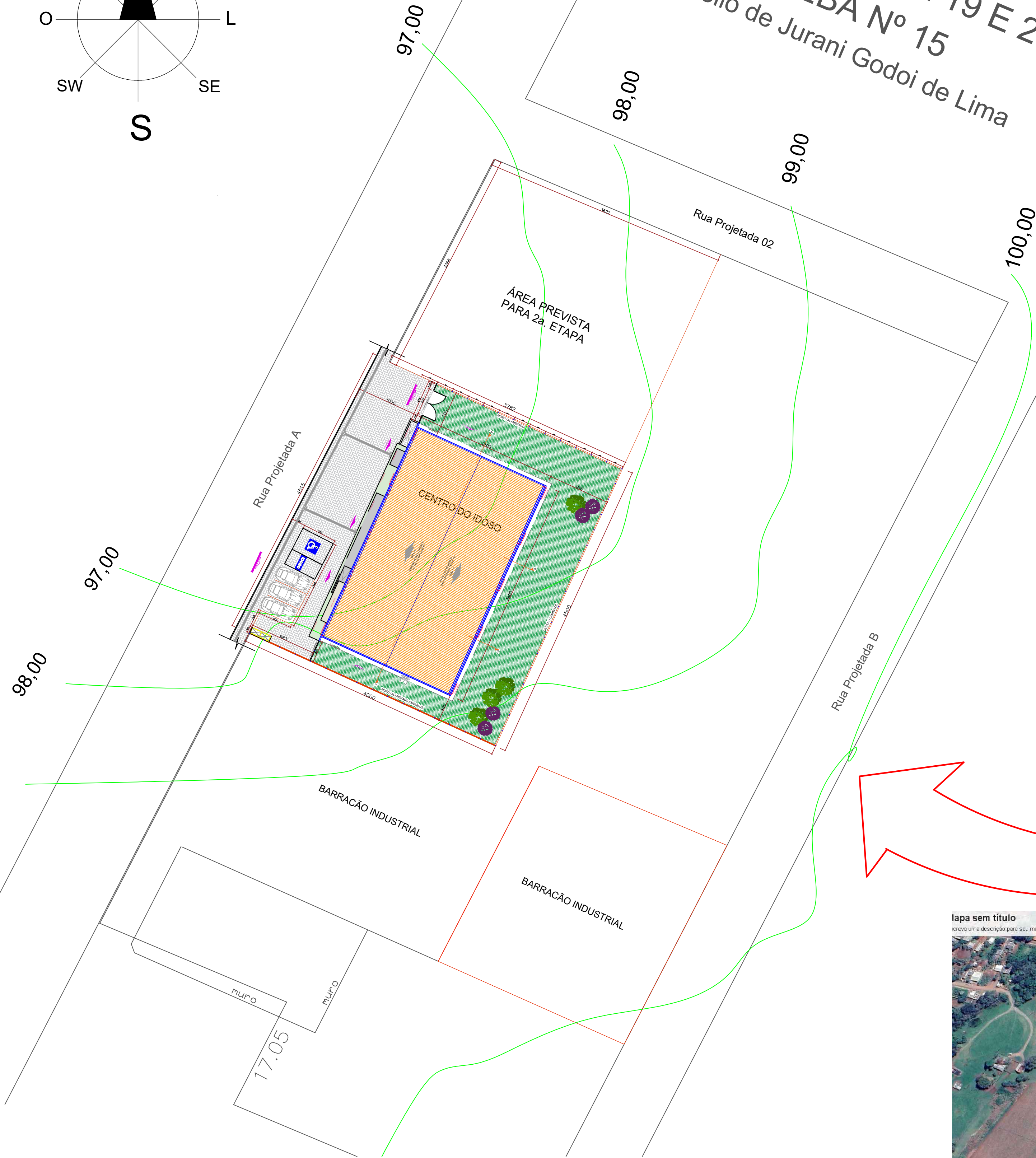
1 PLANTA DE SITUAÇÃO NO PERÍMETRO URBANO ESCALA.....1/400